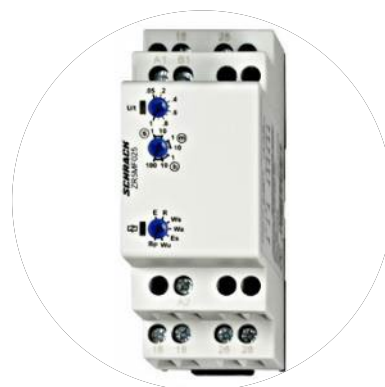
Tidsstyring og Releer