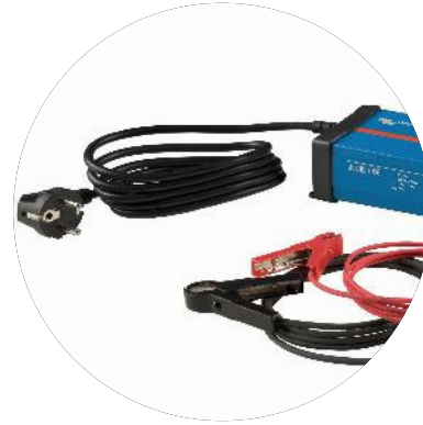
Ladere og Invertere