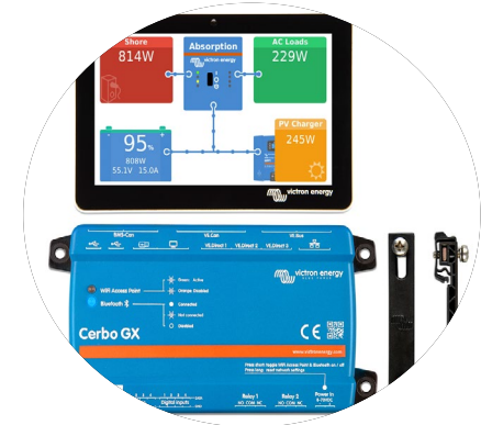
Overvåking og beskyttelse